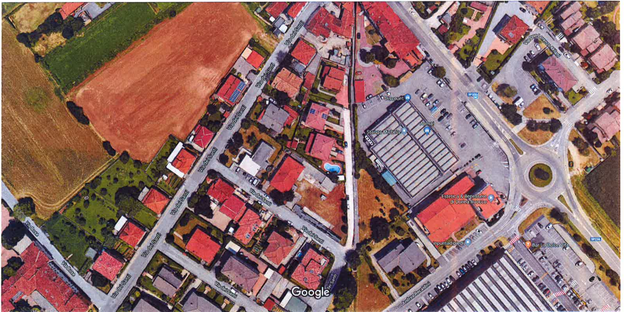
Immagini ©2018 Google, Dati cartografici ©2018 Google 20 m